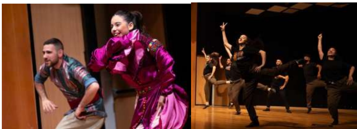
Dabkeh Show by Douban. Foto der Performance am 13.11.2025 im Notre Dame Center, Jerusalem.

Kunst, insbesondere Tanz, Theater, Musik, Malerei und andere Formen, wird als Motor für Resilienz und Hoffnung verstanden. Die Einrichtungen, insbesondere auch die in den Flüchtlingscamps tätigen, bieten Alternativen zur Hoffnungslosigkeit insbesondere bei jungen Menschen und konzentrieren sich auf Träume und Ziele, die über den Flüchtlingsstatus hinausgehen. Kreatives und gemeinschaftliches Erleben fördert Aktivismus und kollektive Verantwortung, anstatt nur auf Lösungen von außen zu warten.