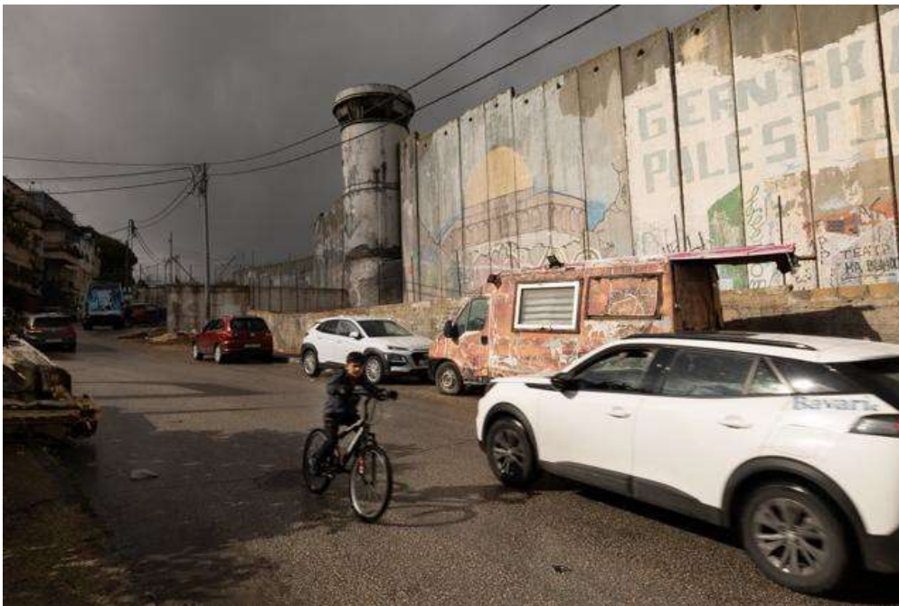
Aida Flüchtlingscamp, Schutzmauer mit Wachturm. Foto © Tom Martinez, FOSNA delegation, November 2025

gepflegt und so markiert werden, dass sie von Angehörigen gefunden werden können. Diese Praxis erscheint mir besonders grausam, weil kein Abschiednehmen möglich ist, heilende Rituale nicht durchgeführt werden können und auch Ängste entstehen, was mit den Körpern der Toten und vielleicht nur Verletzten in den Händen des israelischen Militärs geschehen sein könnte. Die Praxis soll abschreckend wirken, aber sie erzeugt sicher das Gegenteil. Die gleiche Praxis bei einigen, sehr wenigen Geiseln oder verstorbenen Geiseln in den Händen der Hamas wurde weltweit immer wieder medial aufbereitet und verurteilt, das Mitgefühl und die Hilfsbereitschaft war riesig- gilt nicht gleiches für nicht bewaffnete Zivilisten, die durch die das israelische Militär oder Milizen getötet werden?