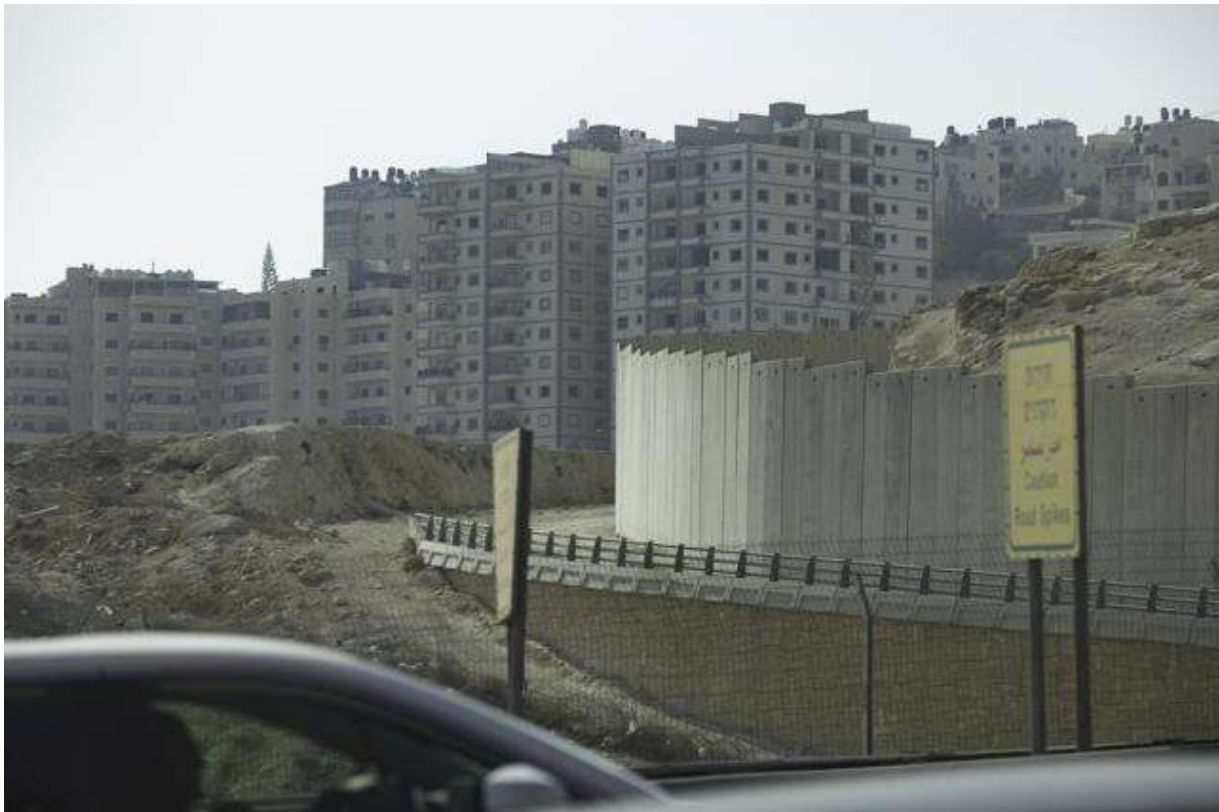
Palästinensische Wohngebäude in Anata hinter der Trennmauer, die das Flüchtlingslager Shuafat in Ostjerusalem umgibt. Foto © Ute Thyen, FOSNA delegation, November 2025

Etwa 20% der Bürger Israels sind Palästinenser:innen, überwiegend Muslime doch auch anderer Glaubensgemeinschaften angehörig. Aida Touma-Sliman, Vertreterin von Chadasch, der demokratischen Front für Frieden und Gleichheit in der Knesset (Parlament) beschrieb auf der Konferenz detailliert die zunehmende Unterdrückung palästinensischer Bürger Israels: legislative Angriffe auf Rechte, Unterdrückung abweichender Meinungen, organisierte Kriminalität und soziale Fragmentierung, verschärft durch die Komplizenschaft staatlicher Institutionen. Angesichts der Vielfalt innerhalb der palästinensischen Gesellschaft in Israel, dem Westjordanland, Gaza, den Flüchtlingslagern in umliegenden arabischen Ländern und in der Diaspora bat sie um Aufbau eines interreligiösen und gemeinschaftlichen Dialogs, um Spaltungen entgegenzuwirken, die Solidarität zu stärken und Versuchen, die palästinensische Identität zu fragmentieren, Widerstand zu leisten. Die Unterstützung für Palästina sollte mit dem breiteren Kampf für Menschenrechte verknüpft werden, um die Unteilbarkeit der Gerechtigkeit in weltweit zu stärken.