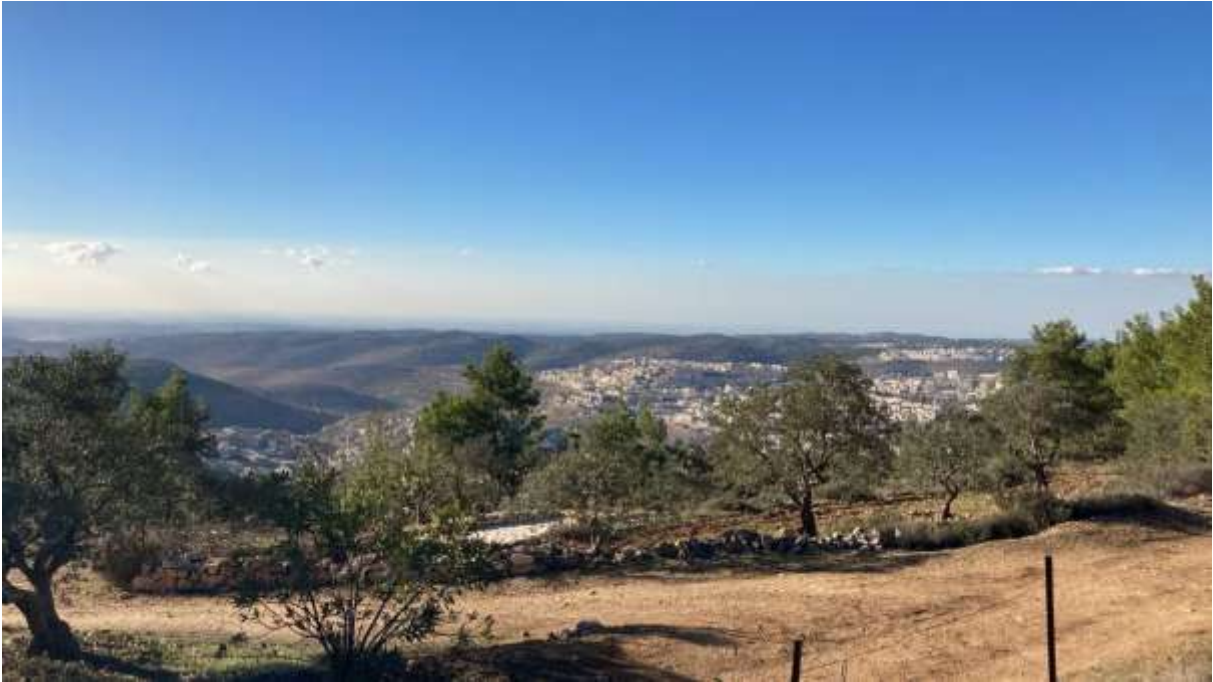
Unterwegs- Blick ins Jordantal auf die Olivenhaine, © Ute Thyen, FOSNA November 2025