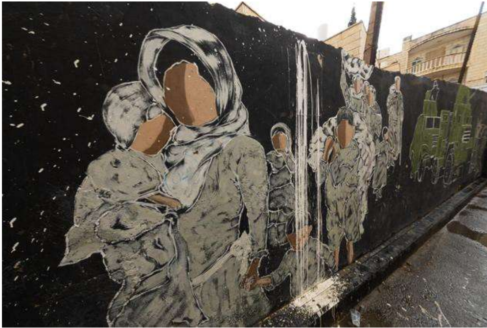
Aida Flüchtlingscamp Bethlehem, umgebende Mauer. Foto © Tom Martinez, FOSNA delegation, November 2025