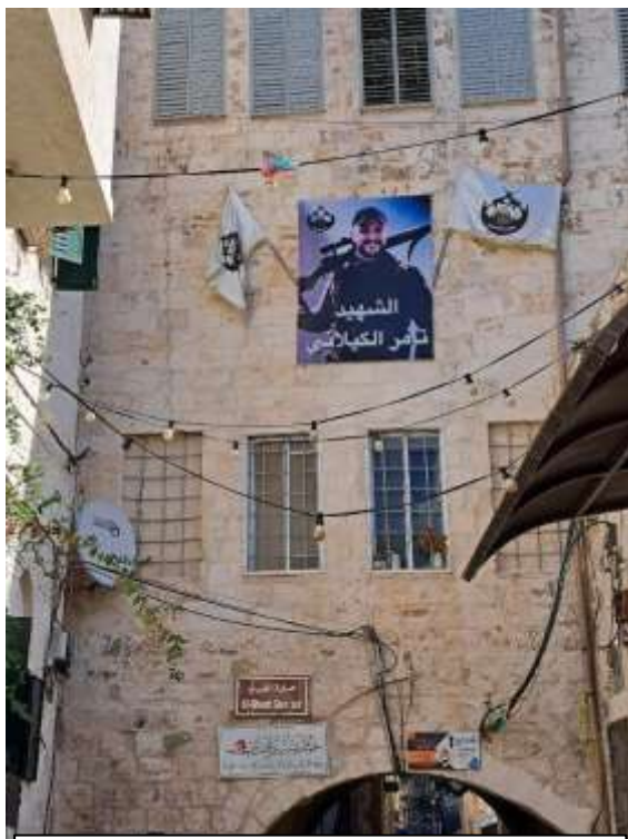
Ehrung eines Anführers des islamischen Dschihad in Nablus. Foto © Ute Thyen, FOSNA delegation, November 2025

In unserer Reisegruppe, wie auch auf der Kairos Konferenz in Bethlehem und den vielen Gesprächen mit unseren Gastgebern an den verschiedenen Stationen der Reise, haben wir darüber diskutiert, welche Formen des Widerstands unter welchen Umständen erklärlich, welche nachvollziehbar und ggf. unterstützenswert sind.