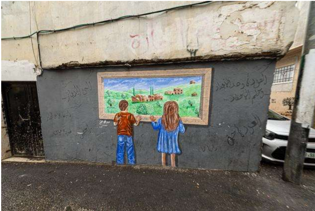
Aida Flüchtlingscamp, Das Recht auf Rückkehr (UN-General Assembly Resolution Nr. 194 11.12.1948.

In den Flüchtlingscamps ist die Unterstützung für den bewaffneten Widerstand augenscheinlich am größten, wenn das auch unsere Gesprächspartner aus den Gruppen, die sich für gewaltfreien Widerstand einsetzen, nicht hervorgehoben wird. Allerdings betonen sie, dass unter Bedingungen,