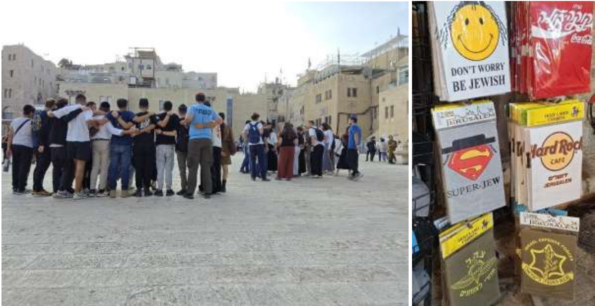
Foto Altstadt Jerusalem. © Ute Thyen, FOSNA delegation, November 2025

Diese jungen Leute auf dem Foto tanzen und singen, sie scheinen etwas zu feiern auf dem großen Platz vor dem Westlichen Wall (Klagemauer). Wir fragen eine Soldatin: es seien junge Rekrut:innen, die gerade ins Militär berufen wurden und sich auf ihren Einsatz freuen und stolz seien, ihr Land zu beschützen. Unter dem Banner „Make Gaza Jewish Again“ wirkt das gespenstisch.